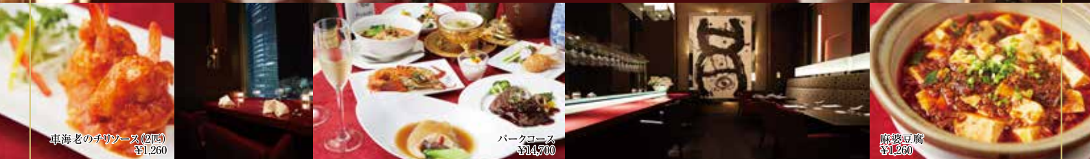
車海老のチリソース(2匹) ¥1,260

本格中華×ワインをお楽しみいただけるホテルレストランです。湾岸エリアの美しい景色とともに、小皿とワインとのマリアージュをお楽しみいただけます。